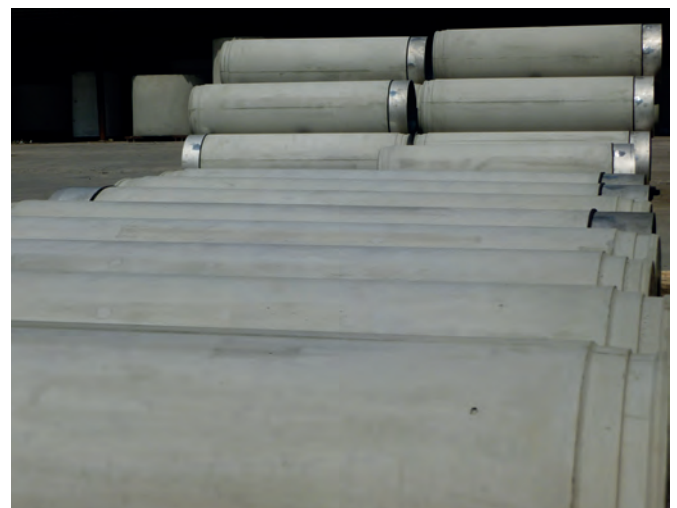
С 2014 г. на заводе в Штэльпхене выпускаются трубы Perfect Pipe для укладки способом продавливания