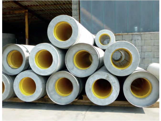
Трубы Perfect Pipe с футеровкой HDPE доступны, начиная с диаметра DN300

методом продавливания не являлось приоритетной целью компании Grafe Beton. Лишь на финальном этапе проработки концепции линии Perfect Pipe компания Grafe Beton и поставщик оборудования Schlüsselbauer Technology решили принять во внимание глобальное расширение этого сегмента изделий. Подавляющее большинство труб, выпускаемых компанией Grafe Beton, предназначены для укладки открытым способом. Это могут быть как железобетонные трубы с интегрированным уплотнением с твердением в опалубке, так и композитные бетонно-пластиковые трубы с футеровкой HDPE для конструкций, подверженных повышенному химическому воздействию. Компания Grafe Beton ведет подготовку к тому, чтобы оперативно реагировать на две различные и частично противоречащие друг другу рыночные тенденции. С одной стороны, не только в Германии при устройстве сточных канализационных сетей все чаще