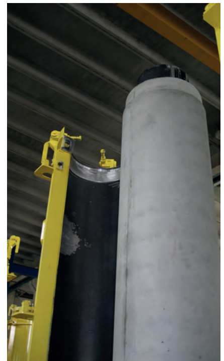
Трубы из подвижного бетона твердеют в опалубке, благодаря чему достигаются очень жесткие допуски