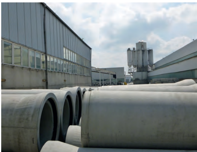
Один из четырех заводов компании Tamara Grafe Beton GmbH – завод в Штэльпхене

нение подобного рода испытано на долгосрочную герметичность под действием давления 2,5 Бар и имеет допуск для эксплуатации в водоснабжении. При укладке труб методом продавливания стыки труб дополнительно защищены внешним разделительным кольцом, которое уплотняется при стыковании с последующей трубой. Передача давления при монтаже осуществляется при помощи традиционных колец определенной толщины. Также для бетонных труб с укладкой методом продавливания возможно использовать управляемые системы передачи давления. Бетонные трубы Perfect Pipe с футеровкой доступны в диапазоне диаметров от DN300 до DN1200, при этом, по окончании пресования, нет необходимости в проведении трудоемких работ, например, роботизированной сварки футеровки. Изначально производство труб для укладки